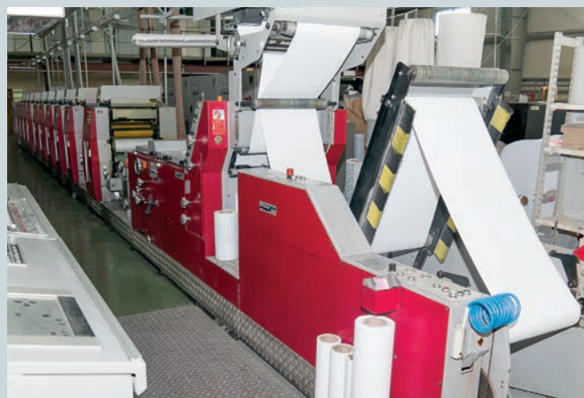
Рулонная печатная машина Muller Martini Concepta в 10-красочном исполнении с секцией лакирования. Используется для печати квитанций, содержащих полноцветные рекламные модули