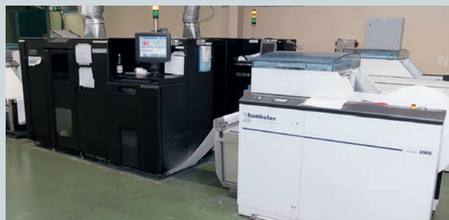
Электрографические машины Ricoh Inforprint 4100 используются для печати не более 5% работ для снятия пиковой загрузки