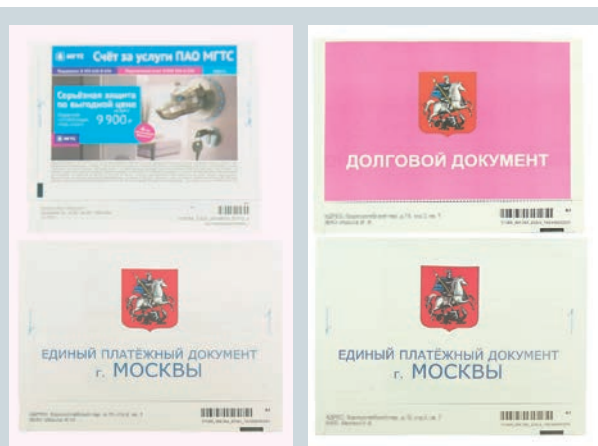
В 2015 г. именно она выступила инициатором создания Единого платежного документа (ЕПД) в виде селфмейлера

Все три машины Xerox Impika Evolution имеют одинаковую комплектацию и предназначены для односторонней монохромной печати. В дополнение к цифровым машинам приобретались модули размотки/наматки рулонного материала компании Hunkeler. «Технология рулонной цифровой печати предполагает наличие оборудования для размотки и наматки материала — это необходимая часть технологического процесса», — поясняет Александр. — С компанией Hunkeler мы сотрудничаем с 2004 г. и