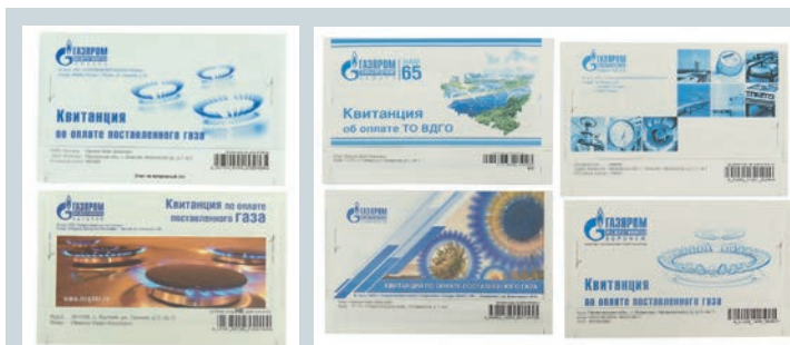
АО «Формс технолоджи» является ведущей компанией в сфере изготовления и доставки платежных документов