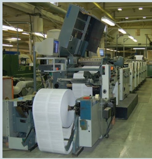
На предприятии работают пять узкоролонных офсетных машин различной конфигурации для печати общей, неменяющейся части квитанций

одного листа и являются одновременно конвертом и информационным письмом. Вскрыть такой документ возможно только оторвав перфорированные полосы по бокам изделия. В 2010 г. мы стали первой компанией, которая предложила в России производство такого вида продукции, в буквальном смысле перевернув рынок почтовой рассылки. Селфмейлеры нашли горячий отклик у клиентов, поскольку представляют собой удобное и бюджетное решение для адресных отправок, минуя традиционную и дорогостоящую конвертно-марочную процедуру рассылки».