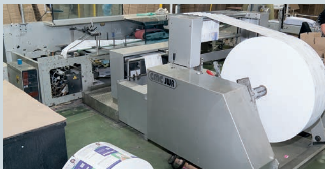
Отпечатанные платежные документы попадают в послепечатный цех, где они фальцуются, превращаясь в селфмейлеры с перфорацией с обеих сторон, и упаковываются для отправки адресату

можно быстрее доставить адресату, — поясняет Александр. — Стандартная практика работы — должно пройти не более 36 ч с момента выгрузки базы данных до доставки готовой квитанции получателю вне зависимости от удаленности региона, в котором он проживает. В силу этих причин у нас существует очень жесткий производственный график, учитывая, что более 80% заказов приходится на одни и те же сроки выполнения. Таким образом, на первую декаду каждого месяца выпадает пиковая нагрузка предприятия. Поскольку у нас, как правило, остается всего около полутора суток для доставки документации, существует и географическое ограничение нашей работы — в пределах 2 тыс. км от Москвы, а это практически вся европейская часть России. Сотрудничество с логистическими службами позволяет использовать разнообразие транспортных средств, чтобы осуществить срочную доставку».