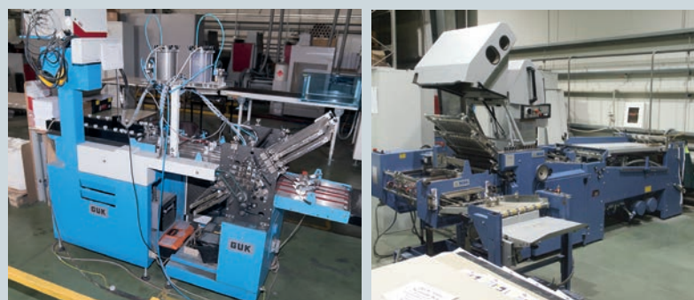
Для выполнения некоторых заказов бывает проще использовать листовую технологию. Для этого применяется оборудование Hunkeler для резки запечатанного рулона на листы, которые затем фальцуются на оборудовании, предназначенном для работы с листовым материалом